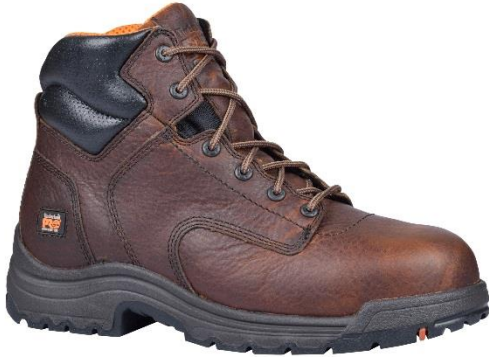
Tallas Masculino 7-12,13,14,15 MW/XW